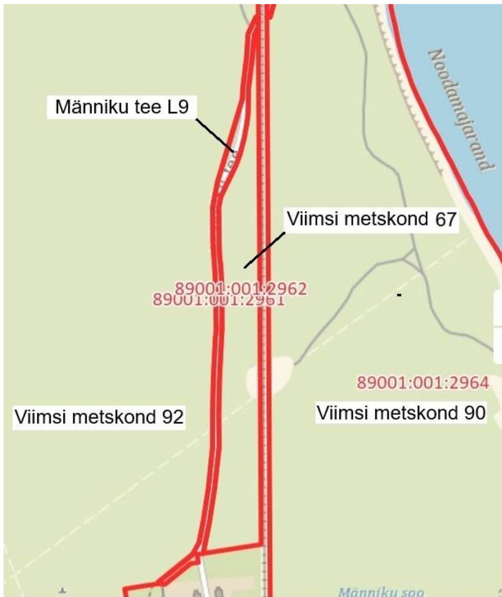
Kaart: Maa- ja Ruumiamet, 2025